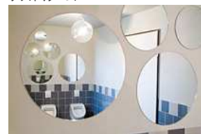
パブリックトイレ